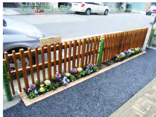
横断防止柵と植栽帯