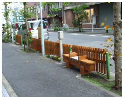
横断防止柵とベンチ

※お問い合わせ先：日本橋みゆき通り道路実験協議会 事務局 03-5651-1550 http://www.miyukidori.jp